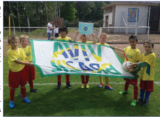
Photo de l'équipe "Débutants" prise lors d'un plateau spécial coupe du monde où ils représentaient le Brésil.